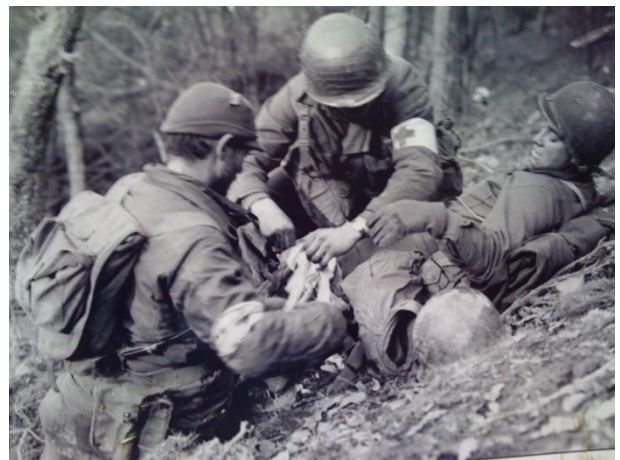
Time for Healing