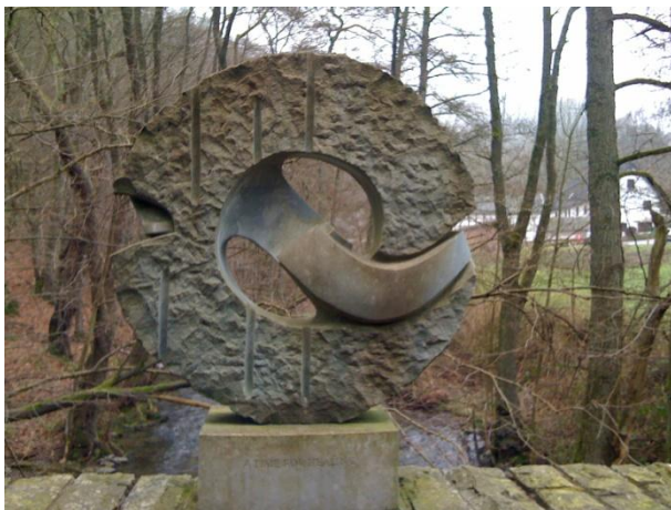
Die Kallbrücke am Kalltrail