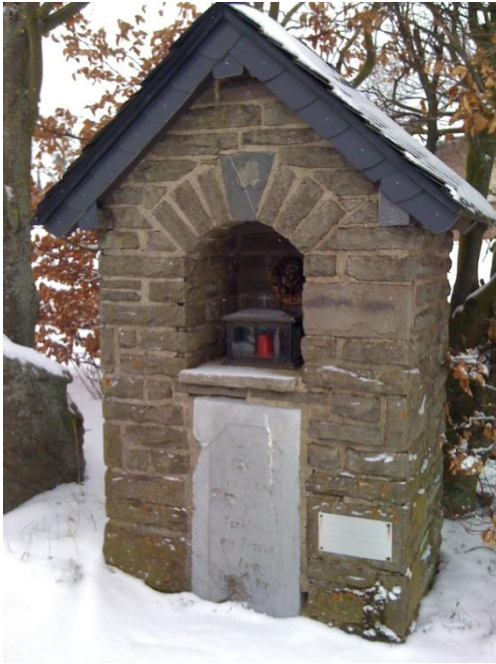
Stumms Krüzche mit Einschussloch